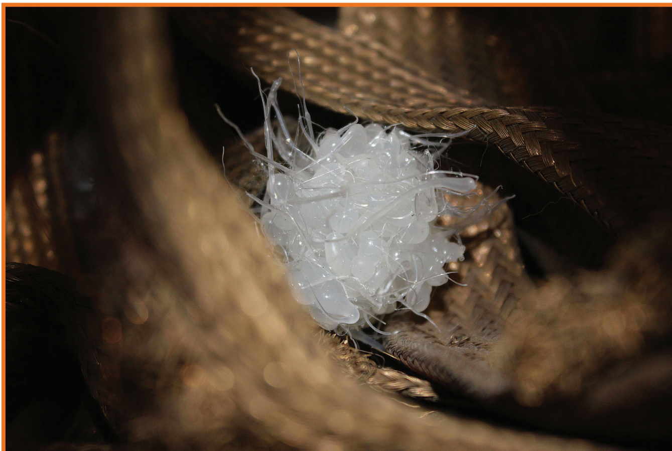
Boules de cuivres : J. Pelletier